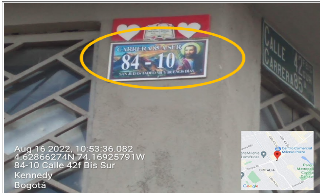
Nomenclatura del predio en el que se sitúa el establecimiento comercial denominado PUERTA DE ORO , ubicado en la CL 42 F BIS SUR No. 84 – 10 .